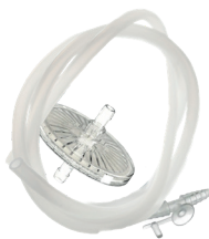
Silikonschlauchset, Art.-Nr.: 048-SP0036/01